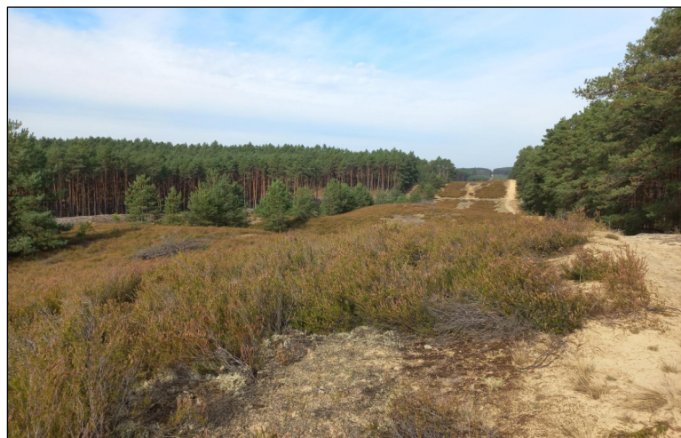
Rycina 5. Fragment użytku ekologicznego “Wrzosowe Wydmy” (autor: Jan Maciorowski)

Opublikowane w ostatnim czasie doniesienia o nowych gatunkach w krajowej arachnofaunie na przykład: Theridion hannoniae (Czeczor 2025), Eresus sandaliatus (Rozwałka and Kolago, 2024), czy Dysdera crocata (Szymański et al. , 2023a) oraz kolejnych stanowisk rzadkich i chronionych taksonów takich jak piaskun wydmy Yllenus arenarius (Szymański et al. , 2025) i Uloborus walckenaerius (Szymański et al. , 2023b), wskazują na potrzebę kontynuowania prac faunistycznych w Polsce.