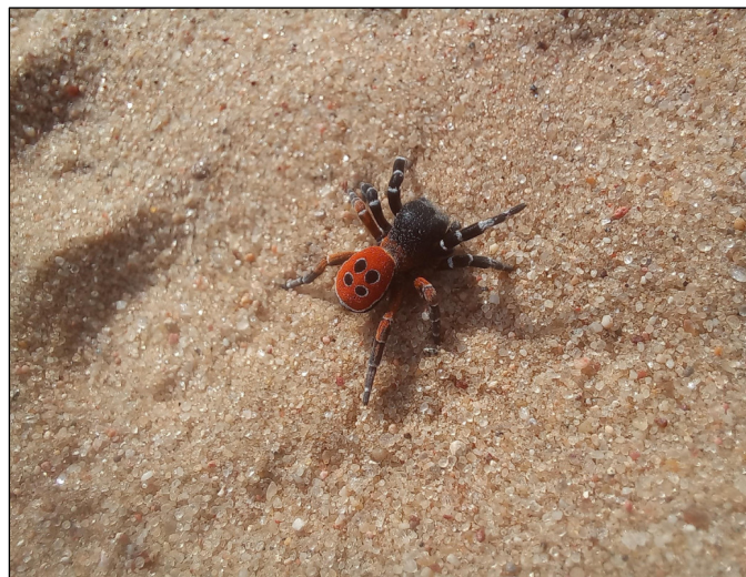
Rycina 1. Obserwowany samiec poskocza krasnego Eresus kollari (autor: Jan Maciorowski)

2008; Rozwałka and Kolago, 2024). Mapy zostały wygenerowane przy użyciu niekomercyjnego programu MapaUTM ver. 6 (Gierłasiński, 2025). Rozmieszczenie stanowisk udokumentowanych w literaturze nanie-siono na mapy opierając się na zestawieniu dostępnym na stronie internetowej "Pająki Polski" (Gierłasiński and Rutkowski, 2025).