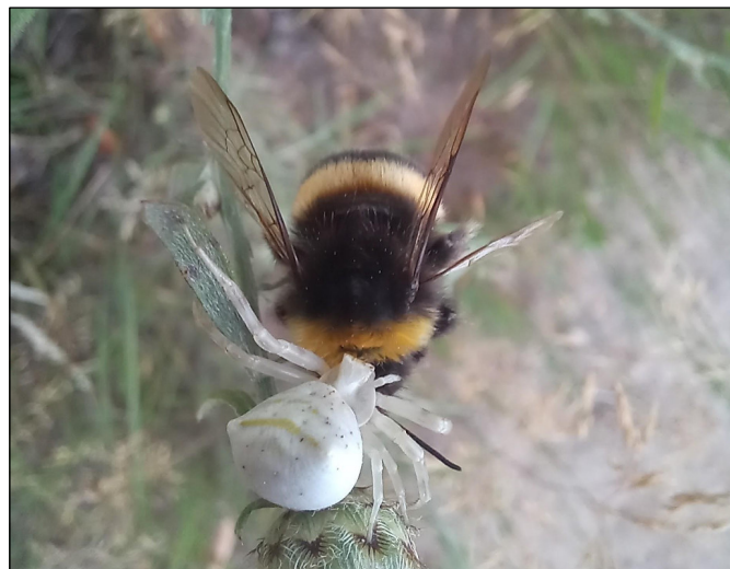
Rycina 2. Obserwowana samica ukośnika Thomisus onustus (autor: Jan Maciorowski)